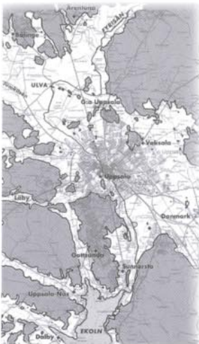
För 4000 år sedan