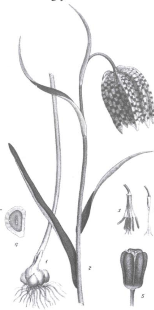
KUNGSÄNGSLILJA, FRITILLARIA MELEAGRIS L.