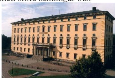
Uppsala universitetsbibliotek - Carolina Rediviva.

De 30 000 studenterna vid Uppsalas två universitet använder sig huvudsakligen av universitetsbiblioteken med sina bruksbibliotek men även av studentnationernas egna bibliotek med stora samlingar och läsplatser. Studenterna söker sig i viss mån också till folkbiblioteken med förväntningen att finna kompletterande fakta och litteratur för sina studier, men använder också folkbiblioteket som medborgare i Uppsala kommun.